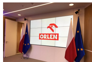
Koncert Zespołu „Mazowsze” w Brukseli z okazji 15-lecia obecności Polski w UE