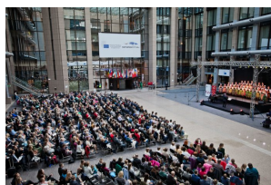
Koncert Zespołu „Mazowsze” w Brukseli z okazji 15-lecia obecności Polski w UE