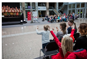
Koncert Zespołu „Mazowsze” w Brukseli z okazji 15-lecia obecności Polski w UE