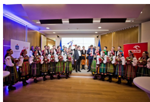
Koncert Zespołu Mazowsze w Brukseli z okazji 15-lecia obecności Polski w Unii Europejskiej. Podziękowania Partner wydarzenia: PKN ORLEN