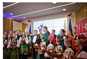
Koncert Zespołu „Mazowsze” w Brukseli z okazji 15-lecia obecności Polski w UE