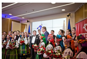
Koncert Zespołu „Mazowsze” w Brukseli z okazji 15-lecia obecności Polski w UE