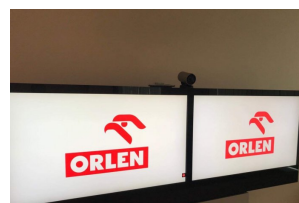
Koncert Zespołu „Mazowsze” w Brukseli z okazji 15-lecia obecności Polski w UE