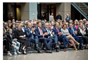
Koncert Zespołu „Mazowsze” w Brukseli z okazji 15-lecia obecności Polski w UE